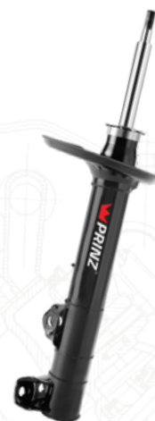
AMORTISSEUR À HUILE OIL SHOCK ABSORBER