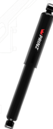
AMORTISSEUR À GAZ GAS SHOCK ABSORBER